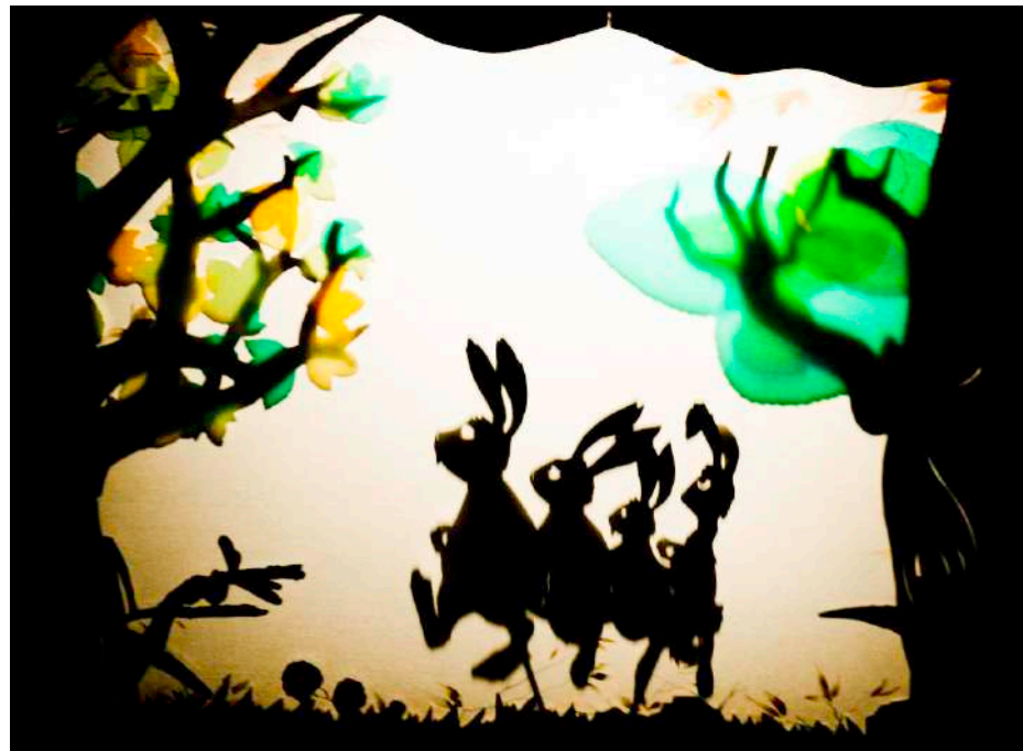
La course

« Loulou est un très beau spectacle que petits, moyens, grands et très grands ont beaucoup apprécié. Pour la plupart d'entre eux, c'était leur première sortie au théâtre, une sortie très réussie. »